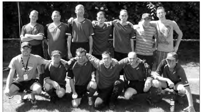
Das Team ist der Star!

Das Resümee des Trainers: „Es war eine sehr ereignisreiche Woche und wir sind mit vielen bleibenden Erinnerungen aus Bremen zurück gekommen.“