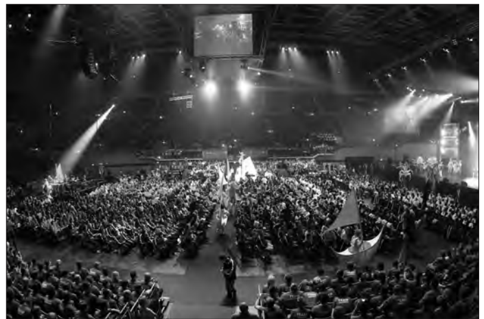
Mit einer mitreißenden, bunten und emotionalen Eröffnungsfeier wurden die National Games eröffnet.