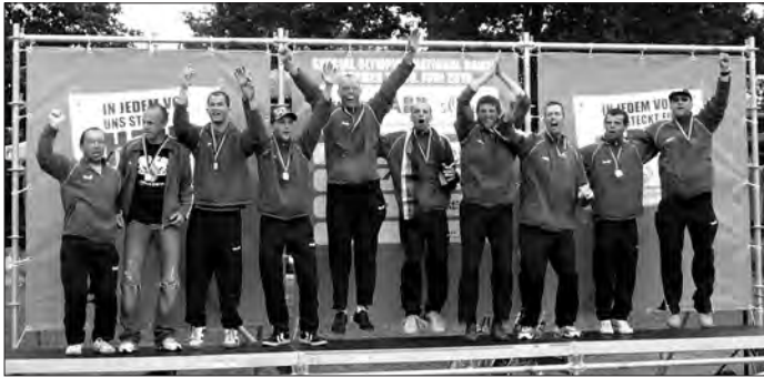
Mit einer geschlossenen Mannschaftsleistung und Fairplay die Goldmedaille errungen - die Fußballmannschaft der HWK

An den Fußballwettbewerben der Special Olympics nahmen in Bremen über 900 Athleten teil, das insgesamt größte Teilnehmerfeld bei den National Games 2010. Gespielt wurde in drei verschiedenen Startgruppen und bis zum Ende der Spiele wurden insgesamt 16 Gruppensieger ermittelt. Auf einem der 16 Fußballplätze unweit des Weserstadions trugen auch die Fußballer der HWK ihre Spiele aus. Was dabei heraus kam, ist absolut bemerkenswert: Gold!