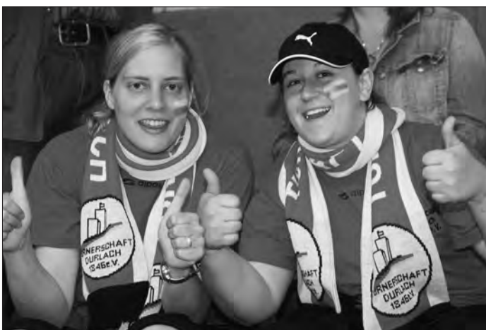
Super Stimmung bei den Betreuern und Fans der Turnados

Und die Neulinge waren von den Bremer Spielen, dem Flair und der besonderen Note genau so angetan wie die "Etablierten" aus Delitzsch, Meissen, Radebeul oder Mechterstädt. Nach den Vorrunden am Dienstag und Mittwochvormittag warfen die Teams in zwei Leistungsgruppen um Tore, Punkte und Medaillen. Bereits vor den letzten Entscheidungen am Freitag zogen Athleten, Veranstalter und Helfer unisono eine zufriedene Bilanz. "Es