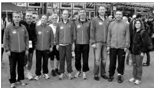
Das Lauf-Team der LG Pfinztal