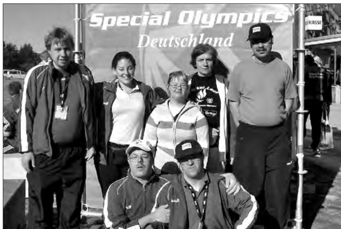
Die erfolgreiche Tischtennisgruppe der HWK in Bremen

Was ist die schnellste Rückschlagsportart der Welt? Bei welcher Sportart wird ein Ball aus Zelluloid verwendet, der hohl ist und einen Durchmesser von 40 mm hat? Ganz klar: Das ist Tischtennis; der Sport, der wegen seiner charakteristischen Geräusche auch als „Ping Pong“ bekannt ist und für dessen Ausübung man eine Tischtennisplatte mit Netz, einen Tischtennisball und pro Spieler einen Schläger benötigt. Obwohl in England erfunden, avancierte Tischtennis schnell in China zum Volkssport Nr. 1. Wie beliebt die schnelle Ballsport aber auch bei Menschen mit Behinderung ist, beweist die Tatsache, dass Tischtennis bei den Special Olympics zu den teilnehmerstärksten Disziplinen zählt.