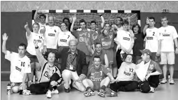
Ein starkes Team: Die Handballer der Durlach Turnados